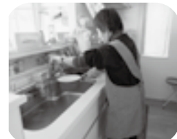
家事支援でサポートする様子