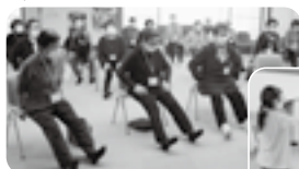
午前の脳トレ・体操の様子