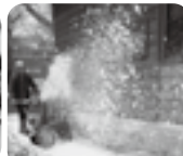
活動本番に向けて事前に操作方法等確認の様子