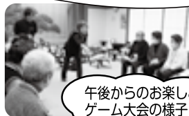
午後からのお楽しみゲーム大会の様子