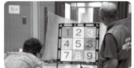
チャリティーニュースポーツ大会