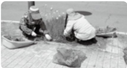
クリーンボランティア大沼

猛暑に迫る日々だった厳しい夏の間もたくさんのボランティア活動をしました! いつもご協力いただき誠にありがとうございます!