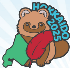
《北海道 エゾタヌキ》