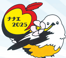
《七飯町 シマエナガ》