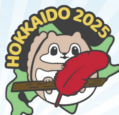
《北海道 エゾモンガ》