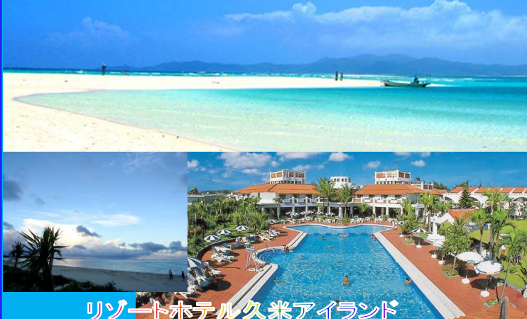
リゾートホテル久米アイランド

沖縄久米島で美しい自然と美味しい料理を楽しみませんか! 1月22日から25日4日間、暖かい沖縄へ!! JA新はこだてふれあい企画のご案内